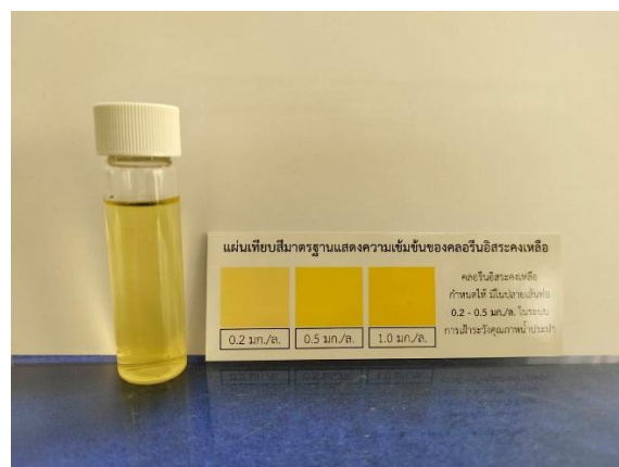
น้ำประปามีคลอรีนอิสระคงเหลือ 0.25 มก./ล.